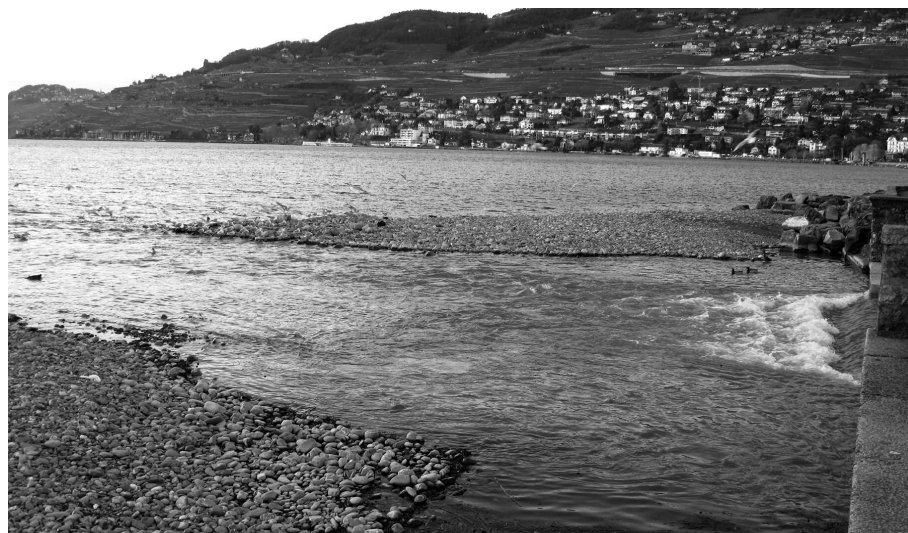
L'embouchure de la Veveyse

Le projet «CANDELA» concerne le renouvellement de notre éclairage public, il est financé par un crédit cadre décidé en 2009 par le Conseil Communal pour une durée de cinq ans. Diverses interventions sur le territoire communal nous ont permis de renouveler partiellement le matériel et principalement d'installer de nouvelles