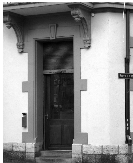
L'Espace Bel-Air accueille les activités du quartier