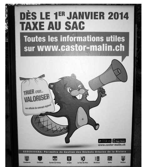
Toutes les infos sur www.castor-malin.ch