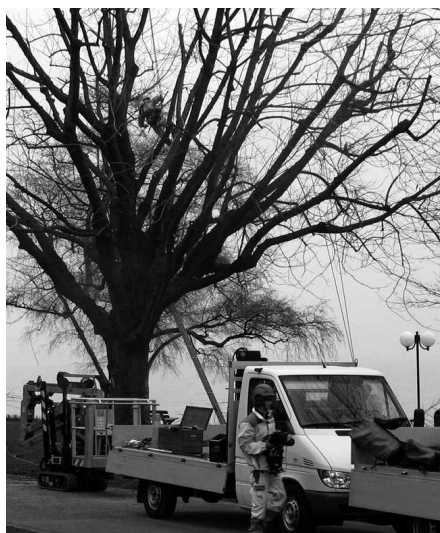
L'entretien des arbres se fait en toute saison

Le nouveau règlement sur la gestion des arbres a été adopté par le conseil