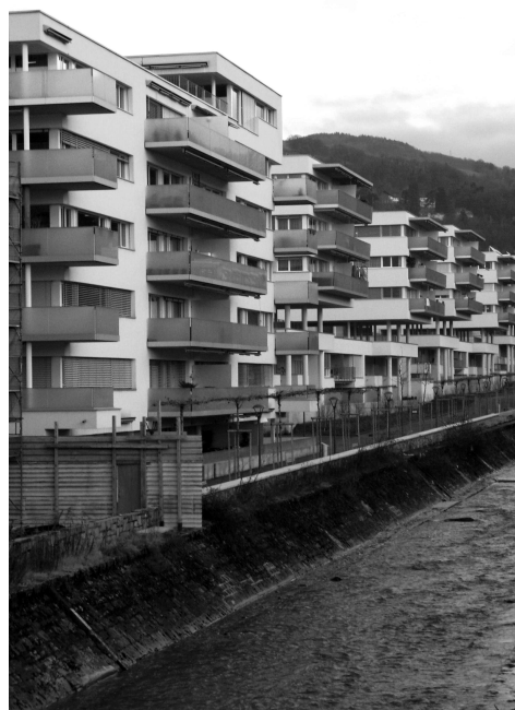
56 appartements subventionnés dans Les Moulins de la Veveyse