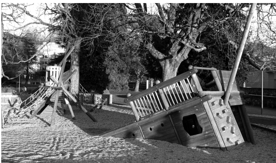
Place de jeu du Jardin Doret